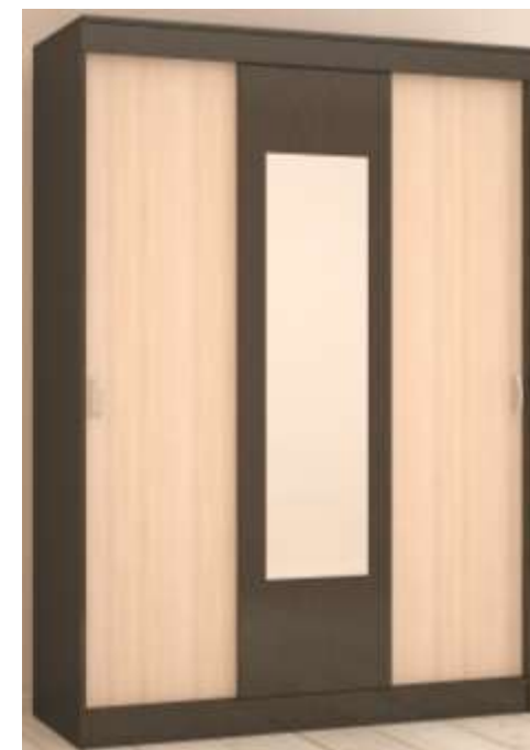
Схема сборки изделия Шкаф-купе «БАСЯ» 2000*1300*500