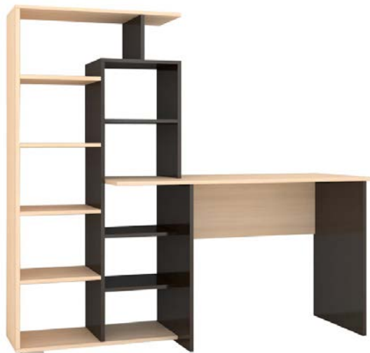
Схема сборки изделия Компьютерный стол «Квартет-4» 1500*1510*500 (ВхШхГ)

Рекомендуется пользоваться услугой по сборке квалифицированных специалистов, имеющих пригодные для этих целей оборудование, инструмент, а также необходимые знания и навыки.